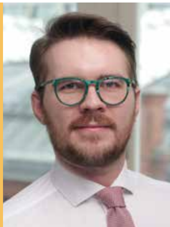
Richard Hartlaub Mirjam Einecke-Renz

In einer Stellungnahme vom März zum Referentenentwurf eines Gesetzes zur Änderung des Tierschutzgesetzes schloss sich die Abteilung Experimentelle Krebsforschung (AEK) in der DKG vollumfänglich einer Stellungnahme der Deutschen Forschungsgemeinschaft an, um für größere Rechtssicherheit für Forschung mit Versuchstieren zu sorgen. Im September bekräftigte die AEK ihre Position noch einmal in einer Stellungnahme zum Referentenentwurf zur Änderung der Tierschutz-Versuchstierverordnung. Zudem gehörte die DKG im März zu den über 200 Verbänden und Organisationen aus dem Gesundheitswesen, die eine Gemeinsame Erklärung zu Demokratie und Pluralismus als Fundament für ein menschliches Gesundheitswesen unterzeichneten.