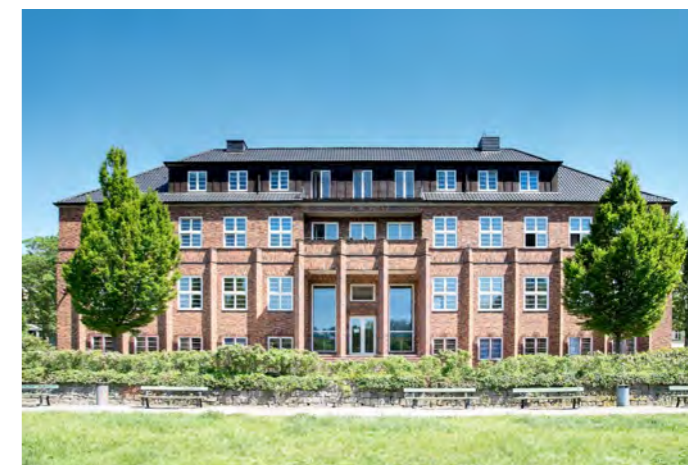
Lietzensee • Kuno-Fischer-Straße 8 • 14057 Berlin

in den Räumlichkeiten der Deutschen Krebsgesellschaft e. V.