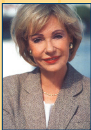
Дагмар Бергхофф Телеведущая

„Как член общества друзей Израильской больницы в Гамбурге, имеющая тяжелую наследственность, как со стороны отца, так и со стороны матери, я отстаиваю право каждого человека на возможность распознавания рака кишечника на ранней стадии, ибо ни при одном другом онкологическом заболевании нет такой почти абсолютной уверенности в его предотвращении.